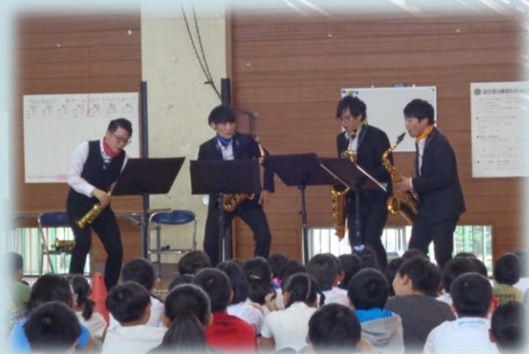
ヴァリオ サクソフォン カルテット 平成30年度合格者 Vario Saxophone Quartetto

日時：令和2年1月19日(日) 午前10時から 会場：川越市やまぶき会館ホール (一般観覧無料)