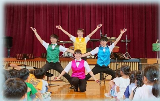
パーカッション アンサンブル「トゥッティ！」 平成30年度合格者 Percussion Ensemble「TUTTI！」